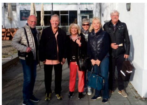
Vöhringer Seniorinnen und Senioren.