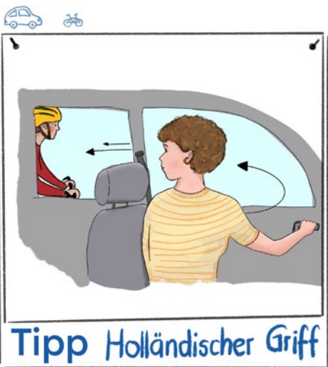
Zeichnung: Esther Schmid, Landratsamt Neu-Ulm

Der sogenannte „Holländische Griff“ ist genauso einfach wie genial: Sie öffnen die Tür Ihres Autos mit der rechten statt mit der linken Hand. Dabei dreht sich Ihr Oberkörper automatisch mit, Sie schauen über die Schulter und können herannahende oder vorbeifahrende Fahrradfahrer frühzeitig und besser sehen. Der „Holländische Griff“ stammt aus den Niederlanden. Fahrschülerinnen und Fahrschüler lernen ihn dort schon seit mehreren Jahrzehnten in den meisten Fahrschulen.