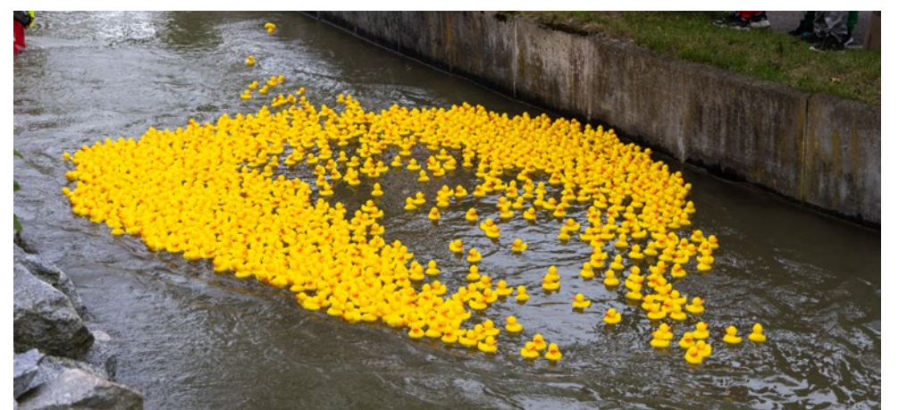
Ein Schnappschuss vom Vöhringer Entenrennen 2024.