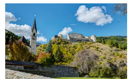
Burgruine Lichtenberg in Prad

► E-Mail: kommunale.jugendarbeit@landkreis-nu.de