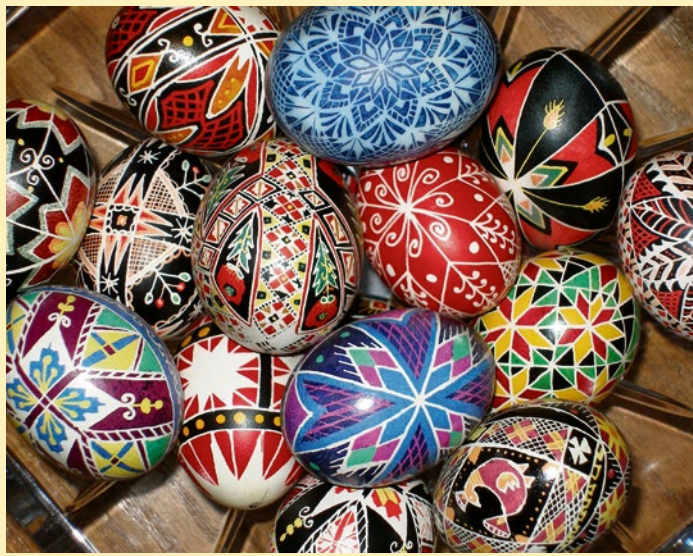
Pysanky – kunstvoll verzierte ukrainische Ostereier