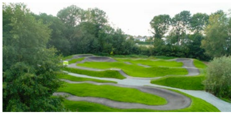
Beispiel-Bild Pumtrack Anlage

Keine Anmeldung nötig. Für Snacks und Getränke ist gesorgt!