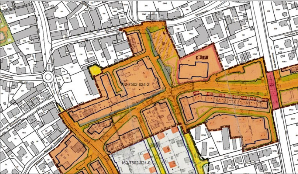
Anlage: Ausschnitt Bebauungsplan NU 14 neu zwischen Riedstraße und Memminger Straße (2. Änderung)

Der Stadtrat der Stadt Vöhringen folgte dem Empfehlungsbeschluss des Bau- und Verkehrsausschusses vom 15.01.2026 und fasste am 29.01.2026 einstimmig den Grundsatzbeschluss zur Erschließung der Hinterlieger-Grundstücke. Er beauftragte die Verwaltung damit, die erforderlichen Planungen aufzunehmen.