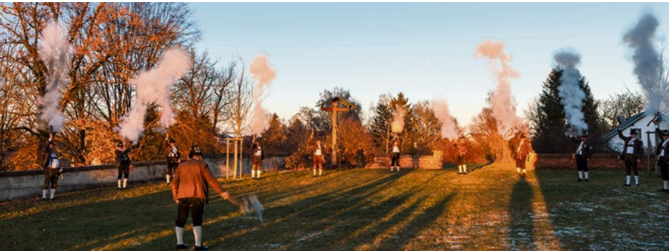
Die Böllergruppe des Zimmerstutzen-Schützenvereins Illerberg/Thal e.V. war bereits nachmittags in Illerberg aktiv.

Die vom Stadtrat in seiner Sitzung vom 18.12.2025 beschlossene 7. Änderung der Beitrags- und Gebührensatzung zur Wasserabgabesatzung der Stadt Vöhringen wird hiermit amtlich bekannt gemacht