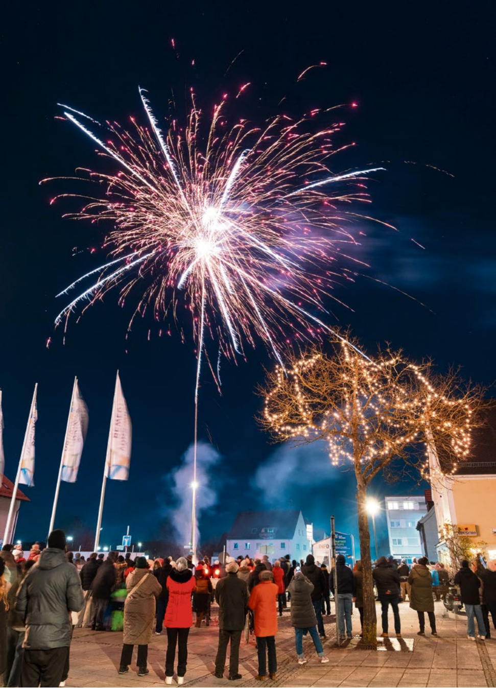
Lichterzauber über Vöhringen beim Silvesterfeuerwerk für Kinder 2025

Jahren zuvor, das traditionelle Silvesterfeuerwerk für Kinder. Ein Brillantfeuerwerk, das den Himmel über Vöhringen verzauberte und nicht nur die Kleinen im Publikum faszinierte. Nebenbei gönnte sich der ein oder andere die in Vöhringen so beliebte „Pudelmütze mit Schuss“, um sich ein wenig auf die bevorstehende Silvesternacht einzustimmen. Für die Kinder gab es leckeren Kinderpunsch, der von der Stadt Vöhringen spendiert wurde.