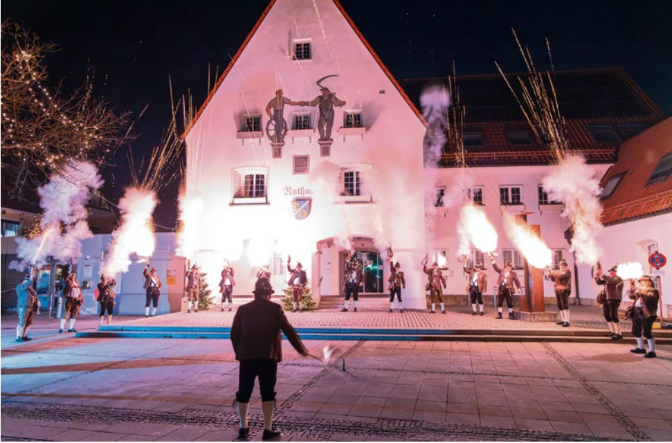
Das Silvester-Böllerschießen 2025 vor dem Vöhringer Rathaus