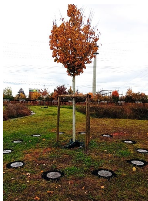
Baumbestattung am Friedhof Süd

Die Vorstellung der neuen Baumbestattungen im Hauptausschuss erfolgte am 10.11.2025.