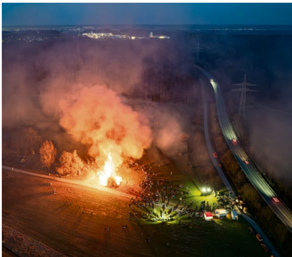
Das Funkenfeuer 2025 in Illerberg/Thal