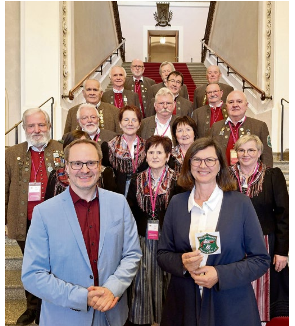
Thorsten Freudenberger (MdL) und Ilse Aigner (Präsidentin des Bayerischen Landtags) mitsamt der Besuchergruppe des Zimmerstutzen-Schützenvereins Illerberg/Thal e.V. im Maximilianeum

Thorsten Freudenberger hob nach dem Besuch hervor: „Es ist mir immer eine Freude, Einblicke in unsere parlamentarische Arbeit geben zu können. Den Zimmerstutzen-Schützenverein Illerberg/Thal habe ich in alter Verbundenheit sehr gerne eingeladen. Er steht für modernen Schießsport ebenso wie für die Tradition des Böllerschießens. Danke dafür und vor allem für den Besuch!“