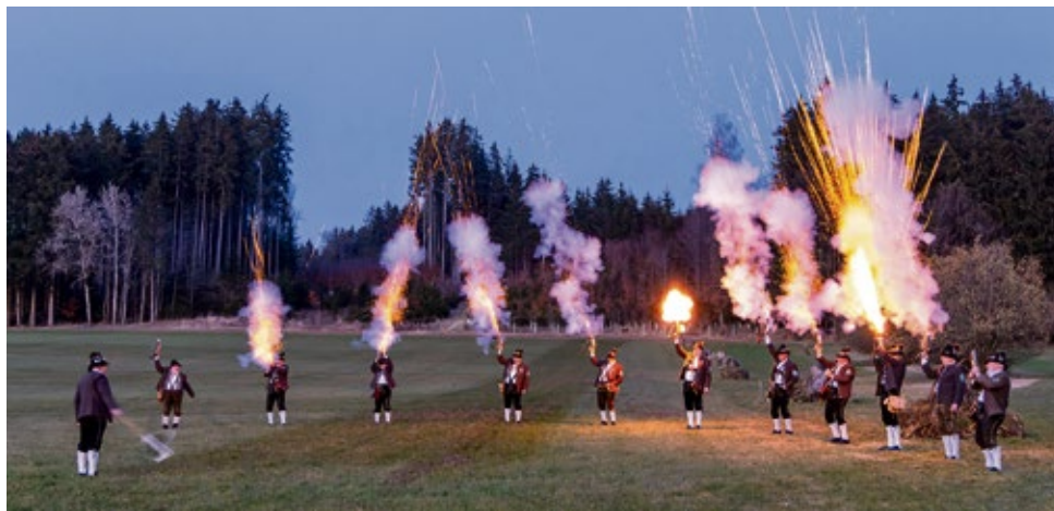
Startschuss der Böllerschützen des Zimmerstutzen-Schützenvereins Illerberg/Thal e.V. zum Funkenfeuer 2025