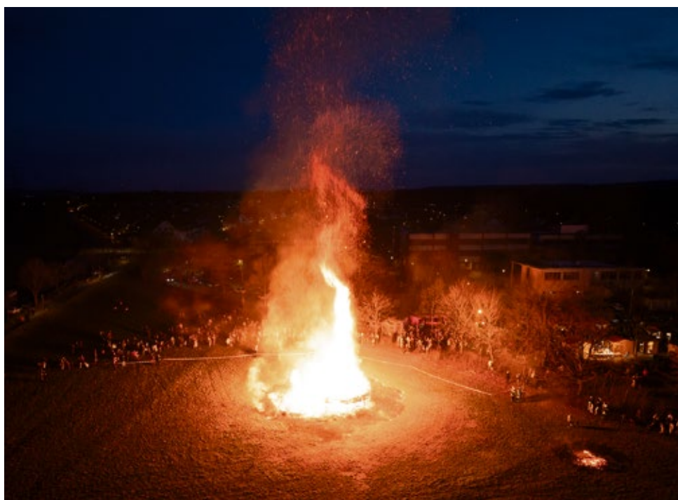
Das Funkenfeuer 2025 in Illerzell