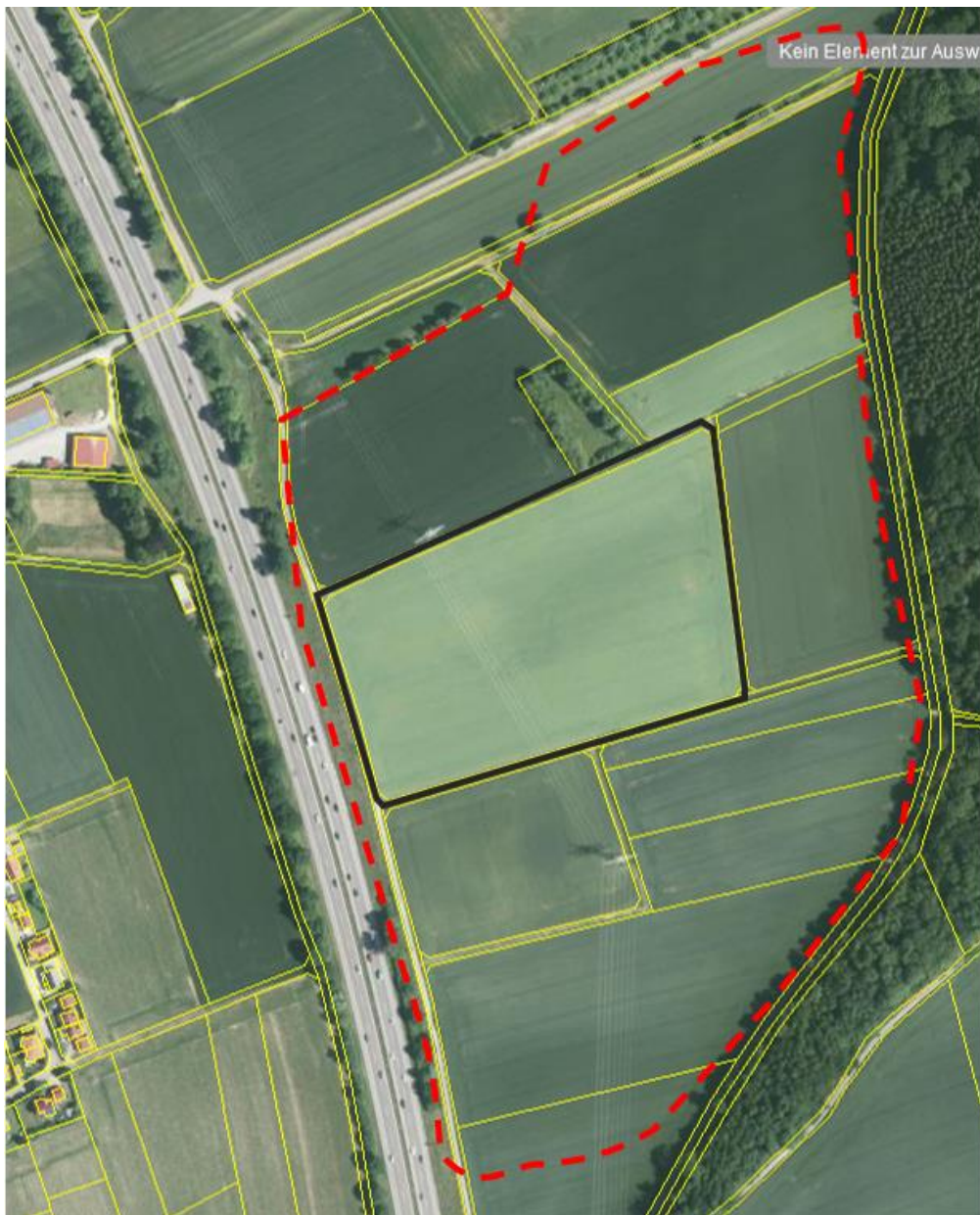
Abb. 1: Lage der Untersuchungsfläche (Schwarz=Untersuchungsfläche, Rot=Vorhabensfläche).

Der Betrachtungsraum der artenschutzrechtlichen Prüfung umfasst das Vorhabensgebiet und den daran angrenzenden Wirkraum von bis zu 150 m (Kulissenwirkung Feldlerche). Die Lage des Untersuchungsgebietes ist aus Abb. 1 ersichtlich.