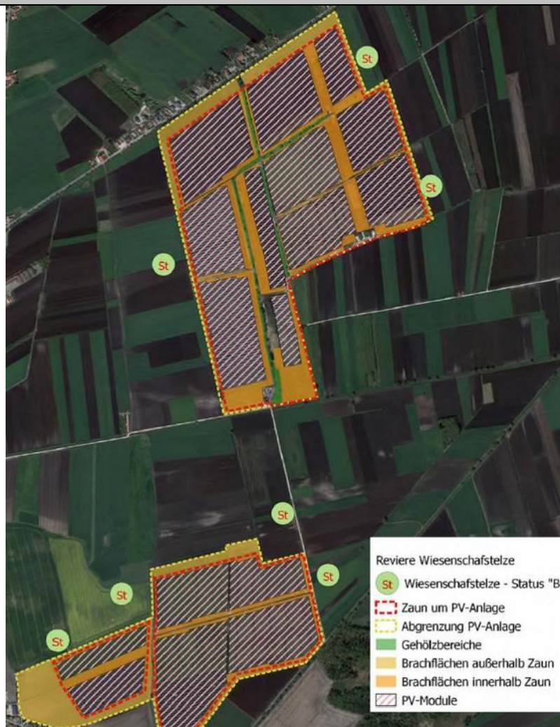
Abb. 4: Ergebnisse Kartierungen PV-Schornhof (LfU 2022)

Konfliktvermeidende Maßnahmen erforderlich: