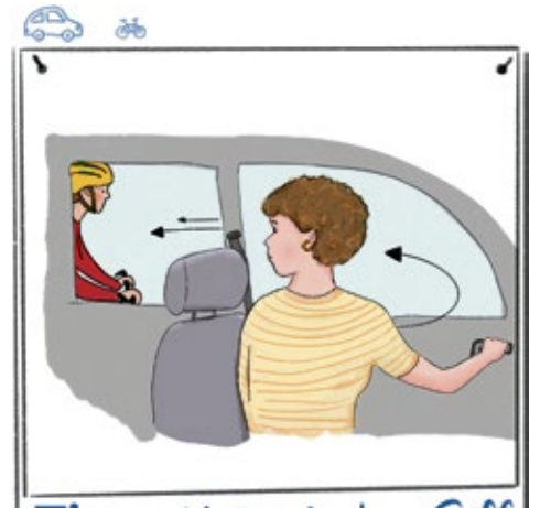
Tipp Holländischer Griff Zeichnung: Esther Schmid, Landratsamt Neu-Ulm

Der „Holländische Griff“ stammt aus den Niederlanden. Fahrschülerinnen und Fahrschüler lernen ihn dort schon seit mehreren Jahrzehnten in den meisten Fahrschulen.