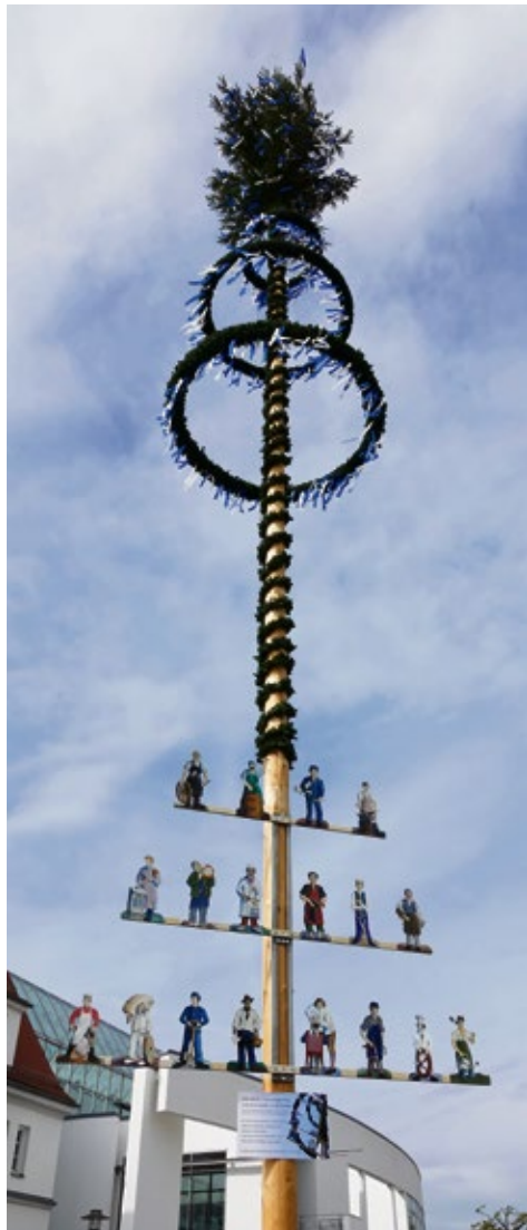
Maibaum Vöhringen 2024 auf dem Hettstedter Platz

Stolz kann ich meine Größe zeigen, drum tanzt um mich den Maienreigen. Werd ich dann verbrannt in heißer Glut „vergesst nicht“ Brauchtum ist das höchste Gut.